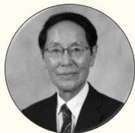
永井 良三 自治医科大学 学長

1974年 東京大学医学部卒業。医学博士。 1983年 米国バーモント大学留学。 2003年 東京大学医学部附属病院病院長。 2012年より現職。 2019年より宮内庁皇室医務主管。ヘルツ賞、日本医師会医学賞など多数受賞。